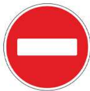
Знак 3.1 «Въезд запрещен»