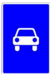
5.3 «Дорога для автомобилей»