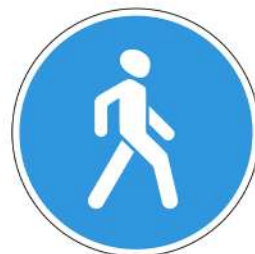
Знак 4.5.1 «Пешеходная дорожка»